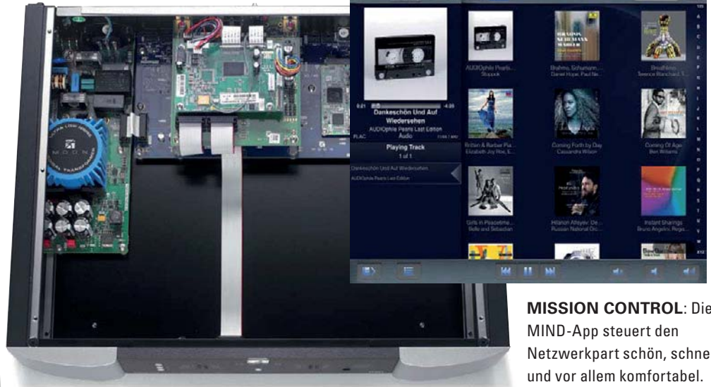
MISSION CONTROL: Die MIND-App steuert den Netzwerkpart schön, schnell und vor allem komfortabel.

WENIGER IST MEHR: Übersichtlich, aber erlesen zeigt sich der Innenraum – von links nach rechts Ringkerntrafo, Digital-Eingangs- und darüber die Netzwerkplatine, rechts Wandler und Ausgangsstufe.